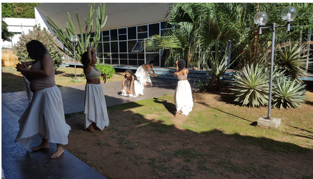
Figura 1. Danza de mujeres en la inauguración del II Seminário Arte/Gênero/Ensino

La realidad brasileña en materia educativa es como mínimo conflictiva, debido a la intromisión del actual gobierno conservador, que está generando una auténtica presión, especialmente sobre el profesorado de humanidades y materias artísticas. De esta cuestión apremiante y de muchos otros aspectos vinculados a la educación artística se habló durante la semana del Seminario, en un ambiente creativo, con una gran generosidad por parte de la organización, y contando con la participación de jóvenes estudiantes y artistas procedentes de distintos estados de Brasil. En la entrevista se cruzan las opiniones de tres profesionales muy implicados en la realidad de la educación en artes brasileña. Una gran oportunidad para escuchar tres voces especialmente relevantes en el panorama de la reflexión sobre género, feminismo y diversidad LGTB dentro del marco de la enseñanza de las artes.