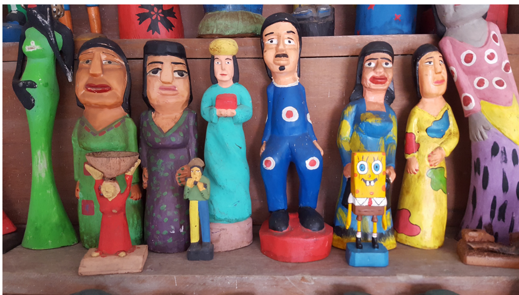
Figura 7. Artesanía popular de la región del Cariri.