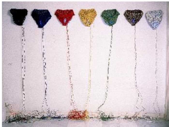
Figura 7. "7 palabras acerca de la sexualidad". Instalación. Obra de Maribel Doménech expuesta en Museari .

Atento y paciente, un joven mira hacia el futuro. El arte permite una mirada más abierta y significativa de nuestros propios procesos de conocimiento. La curiosidad es un camino lleno de sorpresas. Las prohibiciones forman parte del lenguaje del poder.