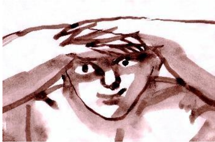
Figura 6. "Observador". Pintura. Obra de José Manuel Guillén expuesta en Museari .

Atento y paciente, un joven mira hacia el futuro. El arte permite una mirada más abierta y significativa de nuestros propios procesos de conocimiento. La curiosidad es un camino lleno de sorpresas. Las prohibiciones forman parte del lenguaje del poder.