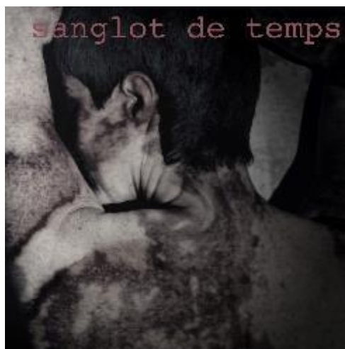
Figura 3. “Sanglot de temps”. Fotografía. Obra de Nora Ancarola expuesta en Museari .

El artista chileno evidencia con su imagen el desequilibrio del sistema educativo chileno, la falta de equidad y la problemática constante que genera. También alude a la problemática del bullying, ya que el acoso escolar entre alumnado diverso sigue siendo preocupante.