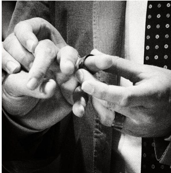
Figura 1 – “Mans d’estimar 2”. Fotografía de Xavier Mollá para Museari

Fuente: https://www.researchgate.net/figure/Figura-1-Mans-d-estimar-5-Fotografia-de-Xavier-Molla_fig1_322159396