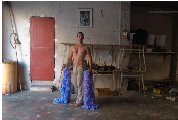
Figura 4 – “Elogio de la pluma”. Fotografía de Pepe Miralles expuesta en Museari

Fuente: http://www.pepemiralles.com/elogia-de-la-pluma-2/