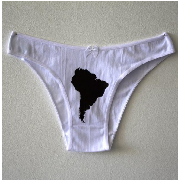
Figura 2 – “Sudamérica”. Montaje. Obra de Álex Meza expuesta en Museari

Fuente: https://www.museari.com/portfolio_page/alex-meza/