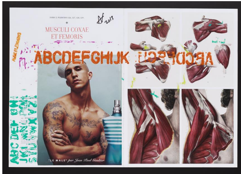
Figura 7 – “Collage 05”. Obra del artista Alex Flemming presentada en Museari