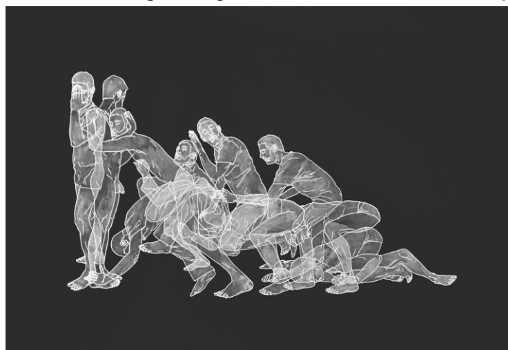
Figura 5 – “Churro, mediamanga, mangaentera”. Obra de Moisés Mahiques en Museari