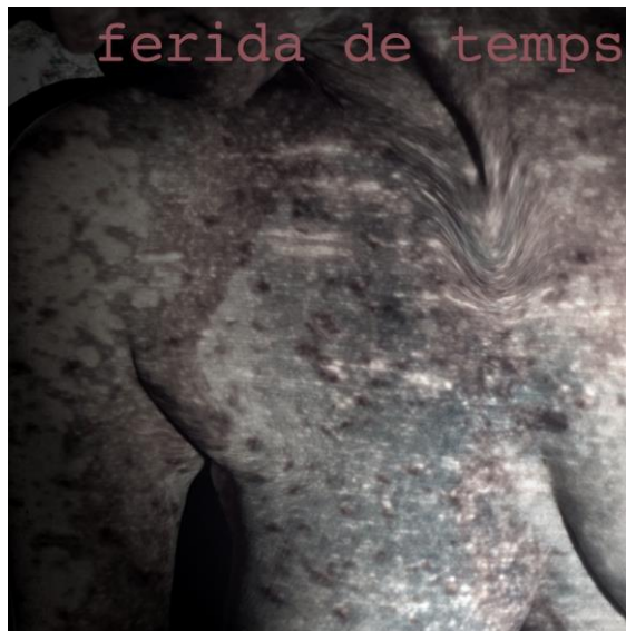
Figura 3 – “Ferida de temps”. Obra de Nora Ancarola expuesta en Museari