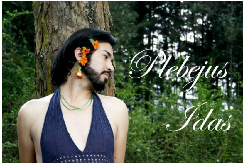
Figura 6 – “Lepidoptera Plebejus Idas”. Fotografía manipulada. Obra del artista ecuatoriano Gledys Macías expuesta en Museari