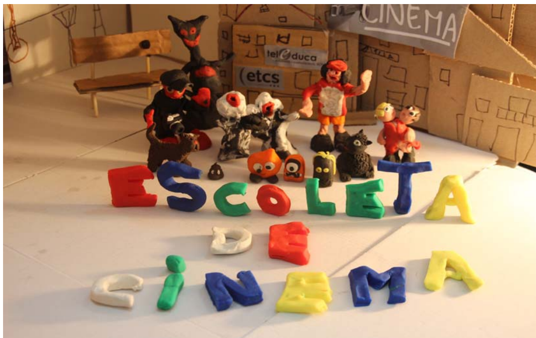
Figura 3. Figuras para elaborar un video mediante stop-motion como spot promocional de “Escoleta de Cinema”.