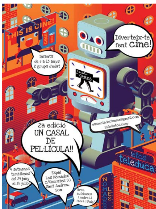
Figura 1. Cartel de la actividad “Un casal de pel·lícula”

Carme Mayugo. En Teleduca siempre nos hemos definido como un colectivo profesional interdisciplinario. Ya de forma constitutiva estamos formados por gente que viene de tres o cuatro campos con interés en trabajar la intersección entre ellos. Uno es el campo educativo desde una perspectiva no directiva, aunque veníamos del aula, pero con la intención de no intervenir, acercándonos a la educación artística y la educación audiovisual de tradición comunitaria o alternativa. Estas tres ramas confluyeron al encontrar un espacio que aquí en España era poco conocido o poco reconocido, pero que en los años 1990 se rescató desde la educación en comunicación. Nosotros veníamos de la tradición latinoamericana (representada especialmente por Mario Kaplún), no tanto de la anglosajona.