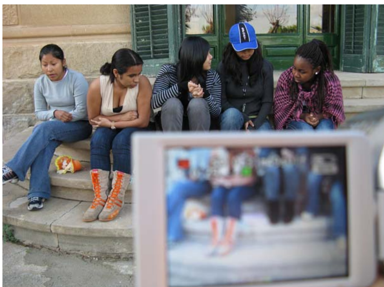
Figura 5. El trabajo con audiovisuales supone para los estudiantes de bachillerato un atractivo contacto con las tecnologías.

Luego está la parte buena del asunto, y es que se da este reconocimiento de que llevamos veinte años con nuestra iniciativa y somos las que más tiempo hemos aguantado en ello, y por eso dicen: si hay alguien que sabe cómo se hace esto es Teleduca. Incluso intentamos llegar a acuerdos con las competidoras.