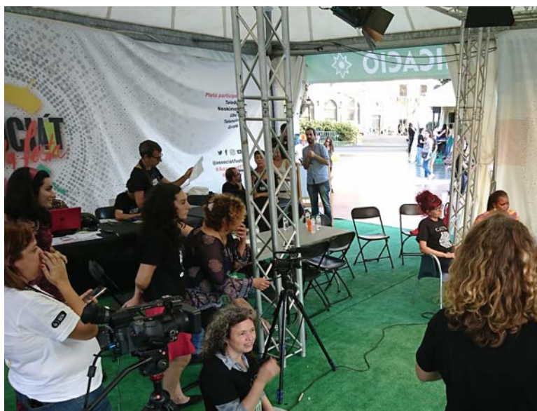
Figura 4. Grabando en el plató participativo de la actividad “Associa’t a la festa”.

que quizás no podrás crecer mucho, o que habrá momentos más bajos, pero no hasta el punto de desestructurar todo lo que habías montado.