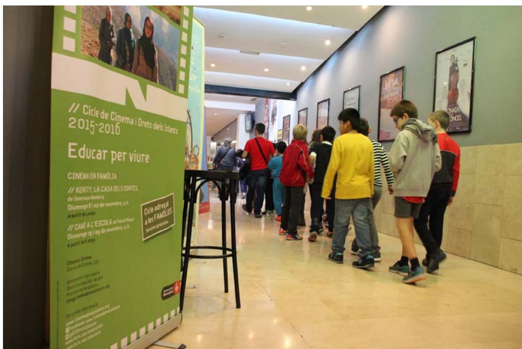
Figura 6. Alumnado asistiendo a las sesiones del “Cicle de Cinema i Drets dels Infants CCDI 2015-2016”