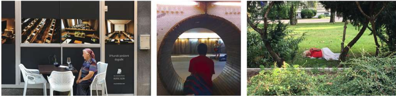
Serie Muestra. Domingo en Mladi levi 2017. Compuesto por 3 fotografías de la autora tomadas en Ljubljana en agosto de 2017. Fig. 5.

“Urbano dejanje” que destaca por la capacidad de reunir en una misma plaza durante una semana diversas disciplinas artísticas: conciertos, mercadillo de productos de diseño o artesanales y actividades participativas (como el graffiti, el dibujo urbano, el tatuaje o el ganchillo). La coexistencia de actividades de diversa índole posee varias ventajas: la generación de sinergias inter y trans-disciplinariamente, la comunicación entre colectivos (compradores, emprendedores, vecinos) y que la oferta cultural resulte más interesante para el público. Su céntrico emplazamiento en la Plaza del Congreso (Kongresni trg) atrae tanto a turistas como a coetáneos, pero se favorece la convivencia y diálogo gracias a la disposición de mobiliario de descanso en forma de pequeñas asambleas, como pudimos comprobar durante varios días. Por un tiempo la plaza se transforma, la gente joven se apropia del territorio y otro tipo de narrativas menos habituales tienen lugar en la ciudad. (Véase fig. 4)