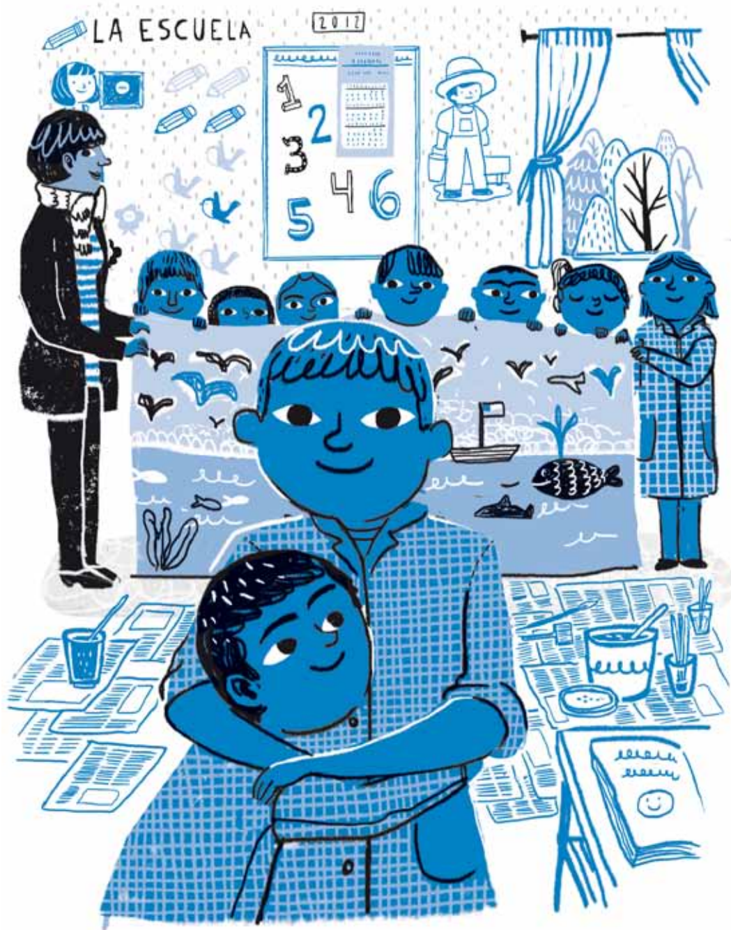
Se evidencian aprendizajes de mejoramiento de relaciones colectivas, desarrollo de confianza, de fortalecimiento de autoestima positiva y autocuidado.