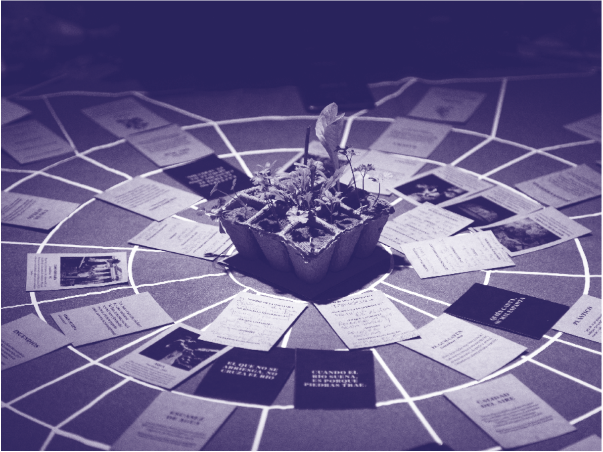
Tablero de juego Secretos de la naturaleza .