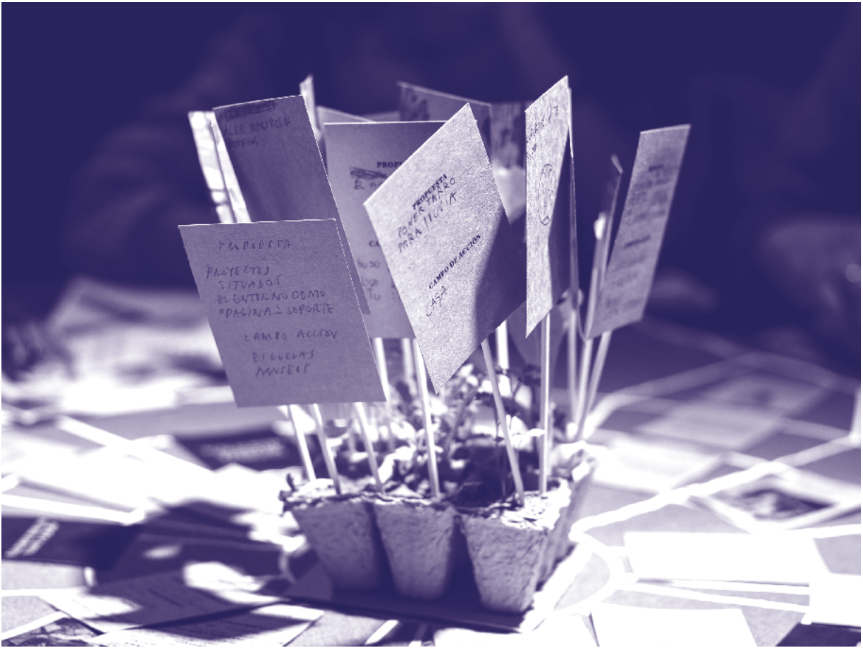
Quinta etapa del juego ¡Hagamos esto!