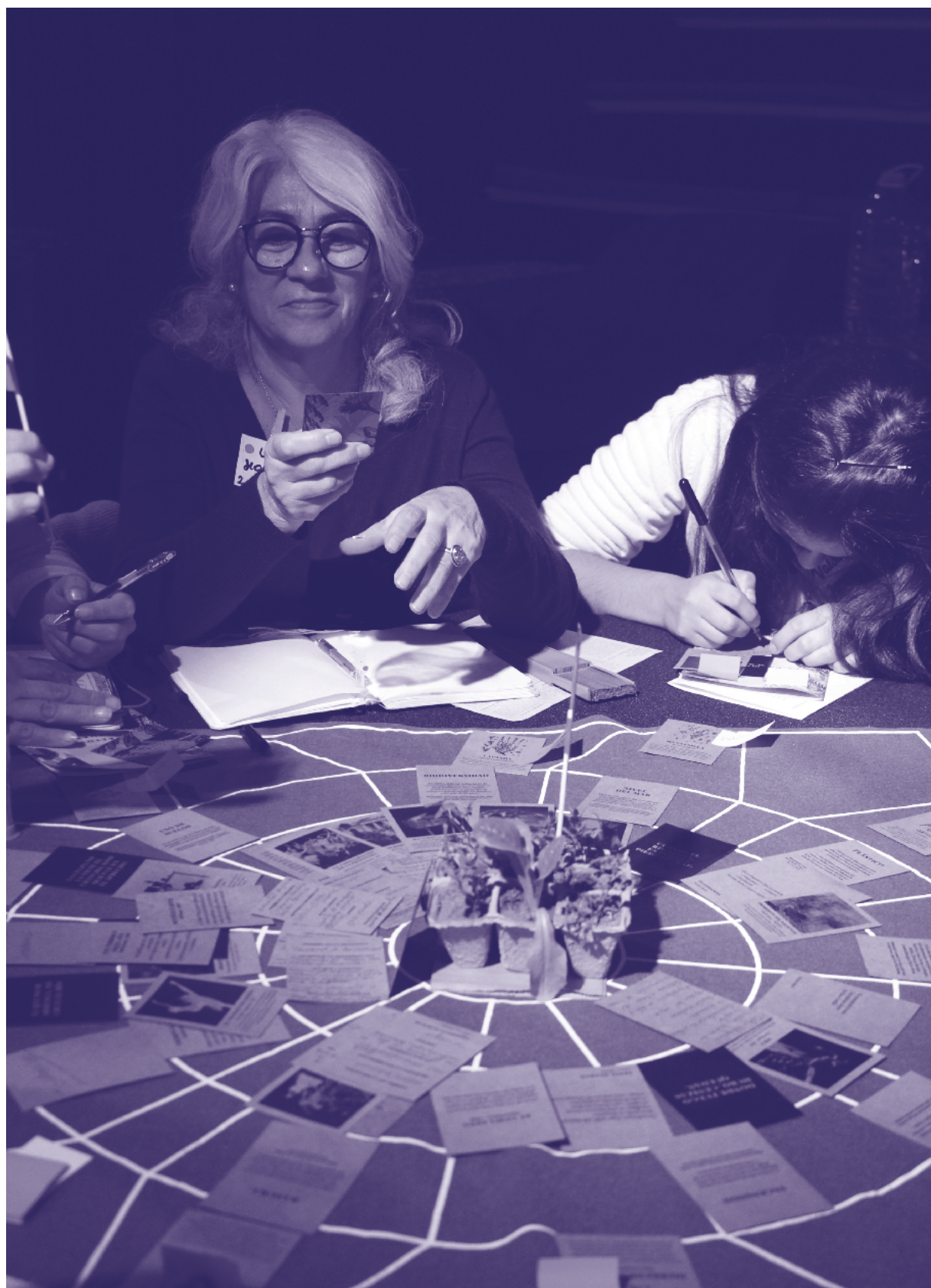
"Comunidad Secretos de la naturaleza" durante sesión en Balmaceda Arte Joven.