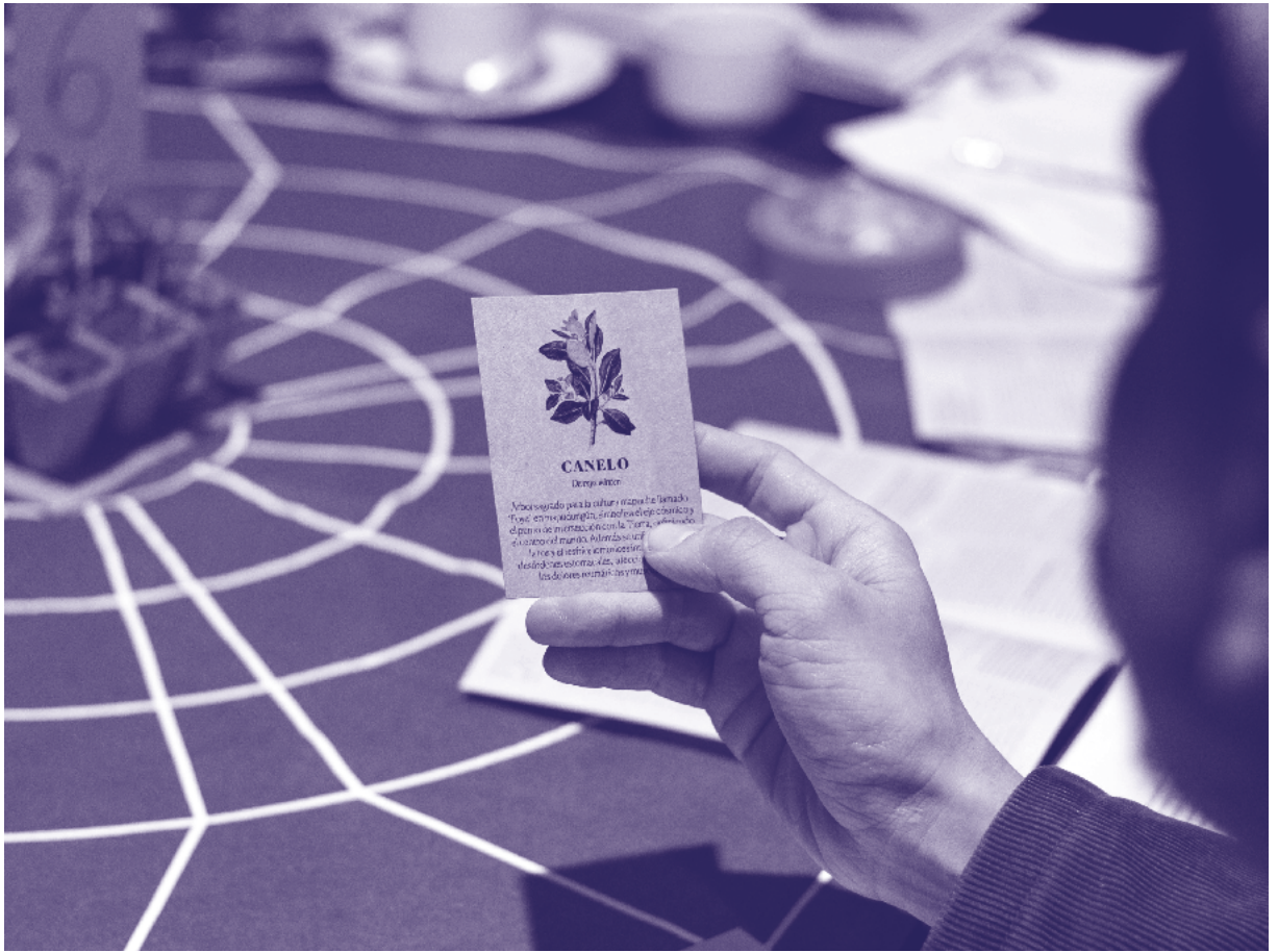
Primera etapa del juego. ¡Hola!, soy una plata.