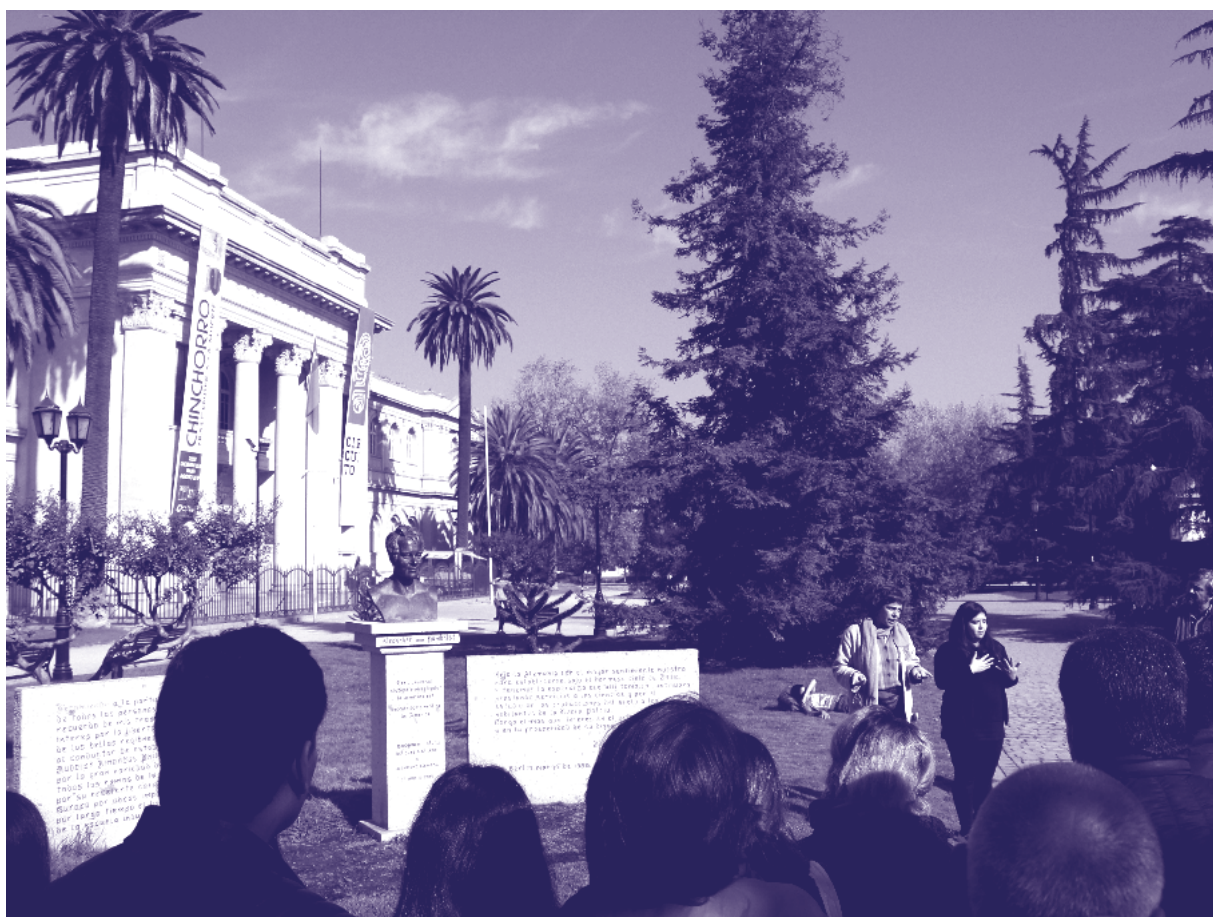
"Comunidad Secretos de la naturaleza" frente a busto de Humboldt.