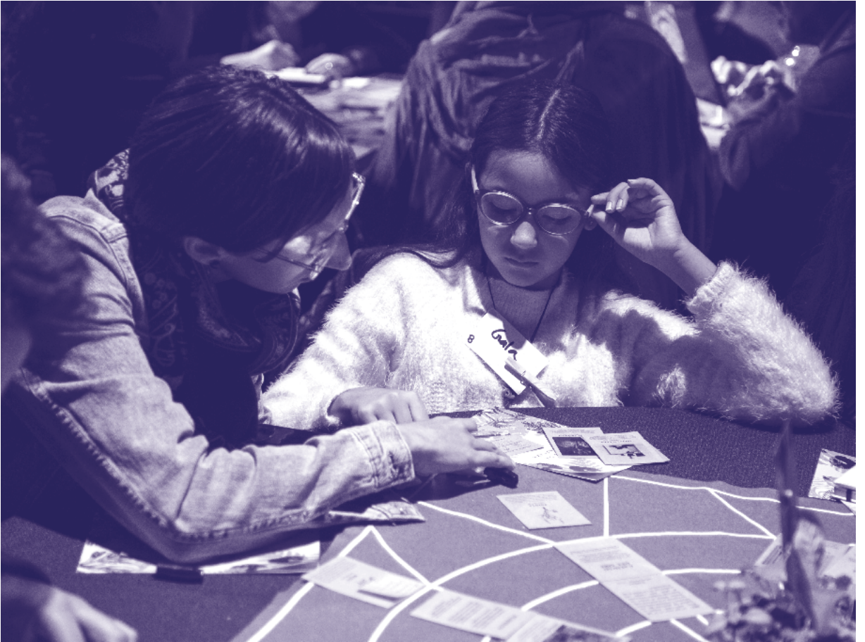
"Comunidad Secretos de la naturaleza" durante sesión en Balmaceda Arte Joven.