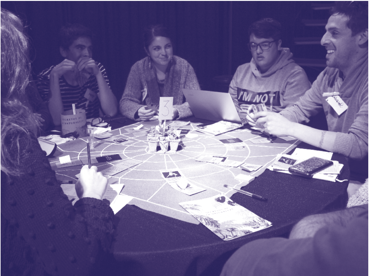
"Comunidad Secretos de la naturaleza" durante sesión en Balmaceda Arte Joven.