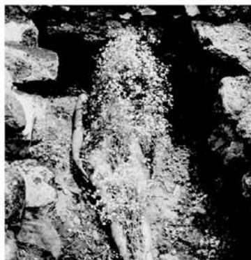
IMAGEN DE YAGUL

Beuys inicia el proyecto 7000 robles en 1982, en ocasión de la documenta 7 en la ciudad de Kassel, Alemania. La intervención consistió en plantar 7000 robles por toda la ciudad, cada uno, junto a piedras de basalto.