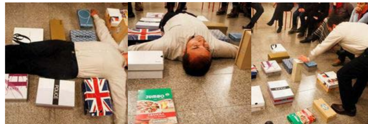
Figuras 10, 11 y 12. El cardus y decumanus de la ciudad cartesiana cuya referencia es el emplazamiento militar romano también remite a la forma de la cruz cristiana.

incluso “sensación de frustración, que se debe básicamente a las relaciones e interacciones de la ciudadanía, donde aislamiento y singularidad definen al ciudadano de Santiago”. Desde la altura de San Carlos de Apoquindo “se ve Santiago despejado con una suerte de alta definición, donde los colores saturados hacen de la ciudad un lugar lleno de optimismo y con más ganas de recorrer aquellas calles aun húmedas por la lluvia envolvente”. Así pues, domina la impresión positiva por el emplazamiento (Careri 2002) y la riqueza paisajística del entorno santiaguino, en contraste con la reacción negativa que provocan los problemas propios de la vida urbana (contaminación, estrés, individualismo).