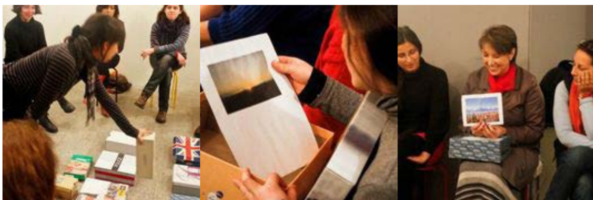
Figuras 7, 8 y 9. Intervenciones de los docentes en el seminario de La Moneda.

La cultura del barrio está tremendamente arraigada en Santiago, donde la participación ciudadana se estructura en municipalidades. Entornos como el de la Quinta Normal con espacios de creación como Matucana 100 así lo atestiguan. Los docentes encuestados valoran la adscripción a comunas y barrios como Concha y Toro, Lastarria, Yungay, Viel, Victoria, o la Comuna La Reina, y desde luego el Parque Forestal. De la zona centro se destaca la iglesia de San Francisco: “en la ventana que da hacia la Alameda, el muro de un carmín azulado es interrumpido por piedras poligonales de diferentes tamaños y formas que la enmarcan; me transporta a otros tiempos; me imagino cómo ha visto cambiar la gente y su entorno; veo historia en ella”.