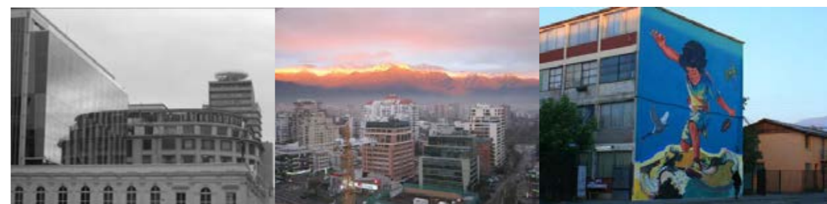
Figuras 4, 5 y 6. Imágenes de Santiago realizadas por los docentes participantes.

Los espacios naturales resultan altamente valorados por los docentes santiaguinos, que destacan la belleza de los parques que cruzan la ciudad otorgándole “cierta calidez que posibilita vivir la experiencia estética de la tranquilidad”. Los recuerdos infantiles bañan numerosas descripciones: “el parque Juan XXIII en Ñuñoa es un lugar mágico, me recuerda mi infancia y me genera la sensación de un lugar oculto; me llama la atención que está rodeado solo por casas que dan directamente al parque”. Incluso se valora la existencia de “un pino muy alto que se encuentra cerca de la calle Nueva Costanera en la comuna Vitacura; encaramándose en él se puede disfrutar de una vista muy íntima, pacífica, única y mágica”. Las vistas panorámicas aumentan su aliciente