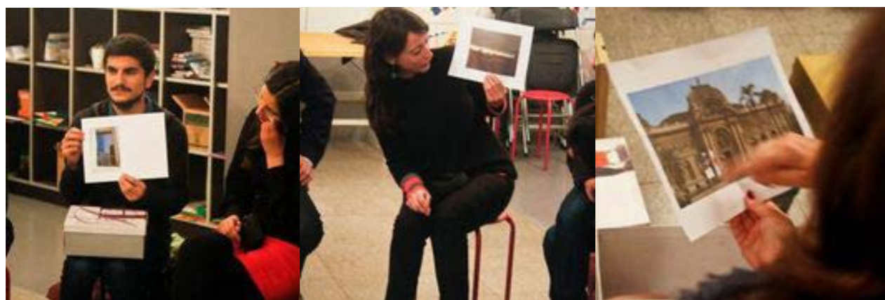
Figuras 16, 17 y 18. Las imágenes de la ciudad que escogen los docentes destacan el papel patrimonial de sus edificios y la importancia de transmitir una identidad.

Podemos recuperar las ideas de Duncum (2008), Freedman (2008), Giroux (2013) y Huerta (2013) cuando apelan a un criterio responsable y participativo más allá de las presiones curriculares. Se considera importante al docente por su aportación “a la construcción de discursos en relación a lo que es o no es la ciudad”. En ese sentido cabe insistir en lo que Borja (2012) y Corti (2012) intuyen como responsabilidad de la ciudadanía, a saber: que nuestro futuro depende del posicionamiento que tomemos como ciudadanos responsables. Una joven maestra uruguaya entiende que su papel “es crucial, pero no exclusivo como lo era hace unas décadas atrás, ya que hoy en día es posible formarse como ciudadano en las calles”. Esta confianza en la participación ciudadana es la que revelan Laddaga (2006) o Huerta (2011) cuando apelan a una mayor actitud artística en la escena colaborativa de lo urbano. También Errázuriz (2006) y Lachapelle (2007) inciden en una formación estética de la ciudadanía, algo que debe ejercitarse en las aulas (Alonso y Orduña 2013, Martínez 2002). En ocasiones se siente “la pertenencia en forma individual, pero falta reforzar la del colectivo, si bien las instituciones no ayudan a fomentar esta idea. Somos una masa de docentes muy grande, y deberíamos crear espacios de encuentro con actividades concretas, ya que si no es muy difícil centrarse y lograr esa identidad de grupo”.