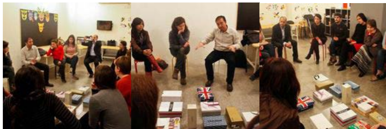
Figuras 1, 2 y 3. Organización de los participantes en la acción performativa.

Tanto en la preparación de las sesiones como en la elaboración de los cuestionarios, nuestra investigación sigue los pasos metodológicos de la interdisciplinariedad, con la educación artística como espacio fronterizo de acción, pero utilizando referencias a campos como la sociología, el urbanismo o la antropología. Se indaga precisamente en base a lo ocurrido en el seminario impartido, lo cual da paso a reflexiones acotadas y recogida de datos. La presencia de acciones performativas (Rogoff 2000, Irwin 2013) así como la incidencia en el proceso, convierten este trabajo en una acción colaborativa, ya que la participación de los implicados es una de las claves del compromiso (Huerta, 2012). El contacto con los participantes nos ayuda a descifrar el propio relato, comprendiendo el fenómeno analizado. Lo urbano es complejo, y la forma de acercarse a la mirada docente hacia la ciudad no puede reducirse a una única datación escrita. Esta metodología híbrida supone una gran implicación por parte del investigador promotor y de todos los participantes. Se establece una confianza entre las partes basada en la negociación. Se anima al colectivo a generar una actividad cooperativa, y ello es posible gracias a las primeras sesiones presenciales, lo cual repercute en un máximo de implicación en la acción performativa y en la confección e implementación de los posteriores cuestionarios.