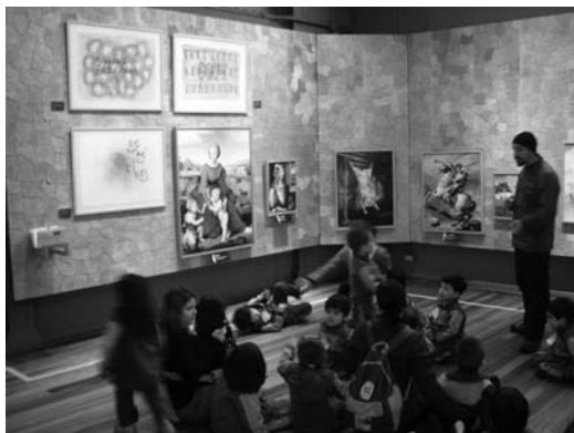
Fig. 6. El alumnado se desenvuelve de forma espontánea, si bien al entrar en el museo se generan perspectivas nuevas que pueden estimular un mejor aprovechamiento del trabajo del educador.

La relación entre las escuelas y los centros de arte parte de la información que puedan recibir los maestros sobre la oferta didáctica de los museos. A partir de las distintas actividades y experiencias que ha desarrollado el MNBA con profesores han podido recoger sus opiniones y detectar que “la información que reciben es insuficiente y deficiente para preparar mejores clases o desarrollar en forma más profunda actividades educativas relacionadas.” Ya veníamos comentando que la conversación telefónica y la recogida de información vía web son los puntos fuertes del contacto, si bien observamos un aumento de las consultas a través del correo electrónico. Actualmente el museo está apoyando el desarrollo del proyecto del área educativa “que contempla un programa de actividades y contenidos que amplíen la mera visita guiada.” Uno de los aspectos importantes que debería mejorar el museo es la difusión de las actividades y exposiciones que se realizan, ya que “debido a la periodicidad muchas veces impiden mantener un continuo contacto con los centros educativos.”