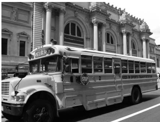
Fig. 3. El traslado desde el centro educativo hasta el museo es una de las mayores preocupaciones que detectamos entre los docentes. Se podría aprovechar este tiempo en el autobús para generar expectativas entre el alumnado.

Durante cuatro años (2006-2009) el grupo de investigación Arte y Educación ha puesto en marcha un dispositivo de distribución de encuestas que han sido contestadas por numerosos maestros e instituciones museísticas del ámbito iberoamericano. Para el presente artículo hemos tenido en cuenta una parte de este trabajo de campo, de manera que los datos que vamos a manejar corresponden a las encuestas recogidas en 2009 en cinco museos de Chile y entre cincuenta docentes del mismo país. Se trata algunas de las muestras más recientes. El estudio se basa en el análisis de las actividades educativas generadas por parte de los museos y centros de arte, a partir de los resultados de la “Encuesta sobre usos y estrategias de los maestros y maestras en las visitas a museos” . Este cuestionario se articula en 60 preguntas distribuidas en cinco apartados temáticos. Cuando preguntamos “¿Qué aspecto cuesta más organizar en la visitas de grupos escolares?” , el 83% de los encuestados responde que su mayor preocupación es “el traslado desde el centro al museo” .