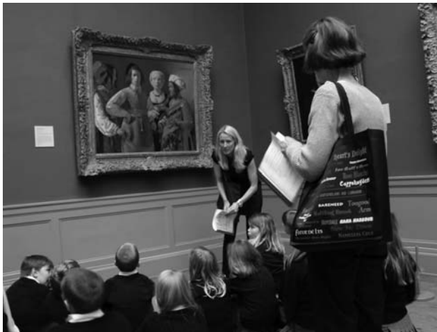
Fig. 1. Mientras la monitora del museo genera espacios educativos con el alumnado que visita la sala, la maestra se sitúa en un segundo plano de acción, como observadora.

Aunque no siempre funciona de este modo, en numerosas ocasiones detectamos la invisibilidad de los maestros y las maestras cuando entran en el territorio del museo de arte. Muchos docentes se sienten incapaces de generar lecturas adecuadas del discurso artístico ante la complejidad que éste genera. No ocurre lo mismo en los museos de ciencias, donde el profesorado especialista suele encontrarse muy a gusto. Algo similar pasa con los profesores especializados en historia, que se sienten cómodos en los museos de historia. Esta tipología de museos se caracteriza por haber introducido algo tan esencial en su discurso expositivo como es la interactividad del usuario. Pero ¿qué ocurre con los maestros y las maestras cuando entran en el museo de arte? Si bien se intenta un acercamiento hacia las obras, no podemos olvidar que la formación en artes visuales de los docentes de educación infantil y primaria es insuficiente, y que en contadas excepciones se sienten preparados para elaborar una lectura adecuada del hecho artístico. Debido a esta supuesta falta de competencia específica en la materia, la maestra y el maestro tienden a situarse en segundo plano durante las visitas, dejando la escenificación en manos del monitor de sala.