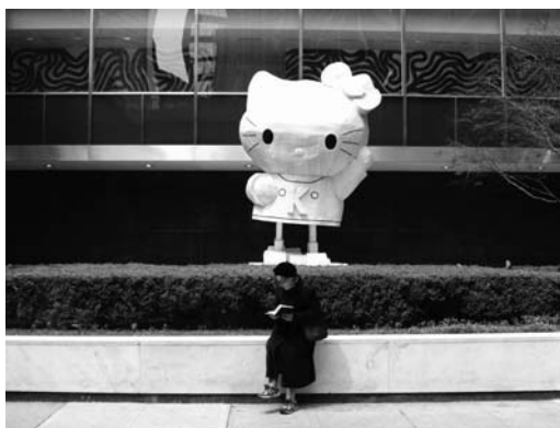
Fig. 5. Para evitar la soledad del docente ante la obra de arte, los gabinetes educativos procuran informar a los maestros de las intenciones y procesos de sus actividades educativas.

De forma muy similar, tal y como hemos comprobado en la recogida de información en otros países, los responsables del museo opinan que los maestros no disponen de la suficiente formación en materia de arte como para desarrollar adecuadamente un modelo de visita activa y crítica. Serán los responsables del área educativa quienes se pondrán en contacto directo con los maestros que preparan sus visitas, cuando éstos llaman por teléfono. En lo referente a las causas que pueden motivar a los maestros a la hora de organizar visitas a museos, en el caso de este museo parten de una premisa: la importancia que representa a nivel nacional el edificio como construcción arquitectónica. Pero también favorece la decisión el hecho de que los planes y programas del Mineduc incluyan el conocimiento de los espacios patrimoniales como un objetivo de los planes de estudio. Además, también influye que se deben incorporar las colecciones de arte como contenidos de clases de historia del arte chileno.