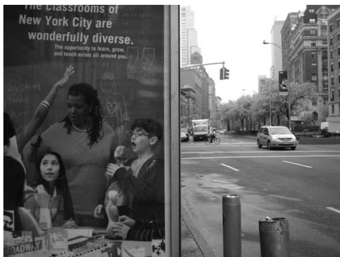
Fig. 2. La escuela y la ciudad constituyen lugares privilegiados para el aprendizaje y para la proyección educativa. Hemos de conseguir que también los museos se conviertan en espacios de creación y de disfrute, más allá de su faceta conservadora.

Esta condición pedagógica de la cual hablan los autores uruguayos remite a la cuestión distintiva que se apodera de las prácticas de la realización artística contemporánea en su origen básicamente pedagógico, ya que surgen en realidad de un acto educativo. Lo desafiante para el pensamiento educativo sería “ cómo construir la posibilidad pedagógica en esa especie de segundo acto donde, para los públicos, ofrecemos el recorrido desde la muestra hacia la experiencia estética y la construcción de significados y representaciones ” (Miranda y Vicci, 2009, 47). La cuestión educativa respecto al arte de los museos ha sido planteada tradicionalmente como una práctica subsidiaria y subordinada del discurso artístico, lo cual ha provocado un discurso educativo del museo muy pendiente de metodologías procedimentales, con poca capacidad cognitiva. Todo ello ha impedido hasta ahora desarrollar el potencial en el que se inscriben la imaginación o el trabajo colaborativo. Con el fin de superar estos condicionantes, proponemos prácticas que vayan de lo educativo hacia lo artístico. Para ello, de nuevo, el papel de las maestras resultará fundamental, ya que será en los centros educativos donde germinará la actividad educativa que después se reforzará en el museo.