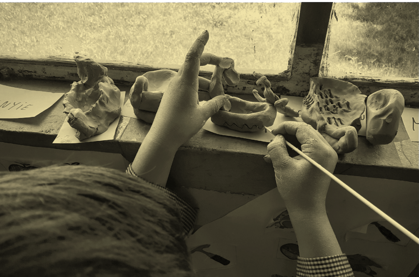
Jornadas provinciales de estudiantes Acciona.

“Siempre hemos visto la necesidad de hacer partícipe a niñas, niños y jóvenes, no sólo como beneficiarios sino como parte integral de Acciona en su proceso”.