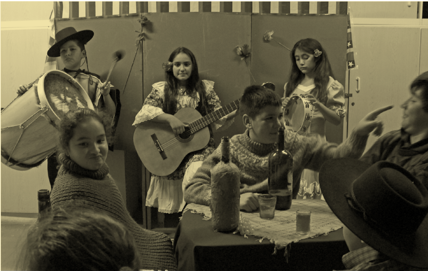
Proyecto Violeta Parra 100 años, Alethia San Martín.

“Cuando quedamos seleccionados en el Festival de Cine Infantil Pichikeche, los niños no lo podían creer. Estaban súper contentos porque nunca habían vivido algo así”.