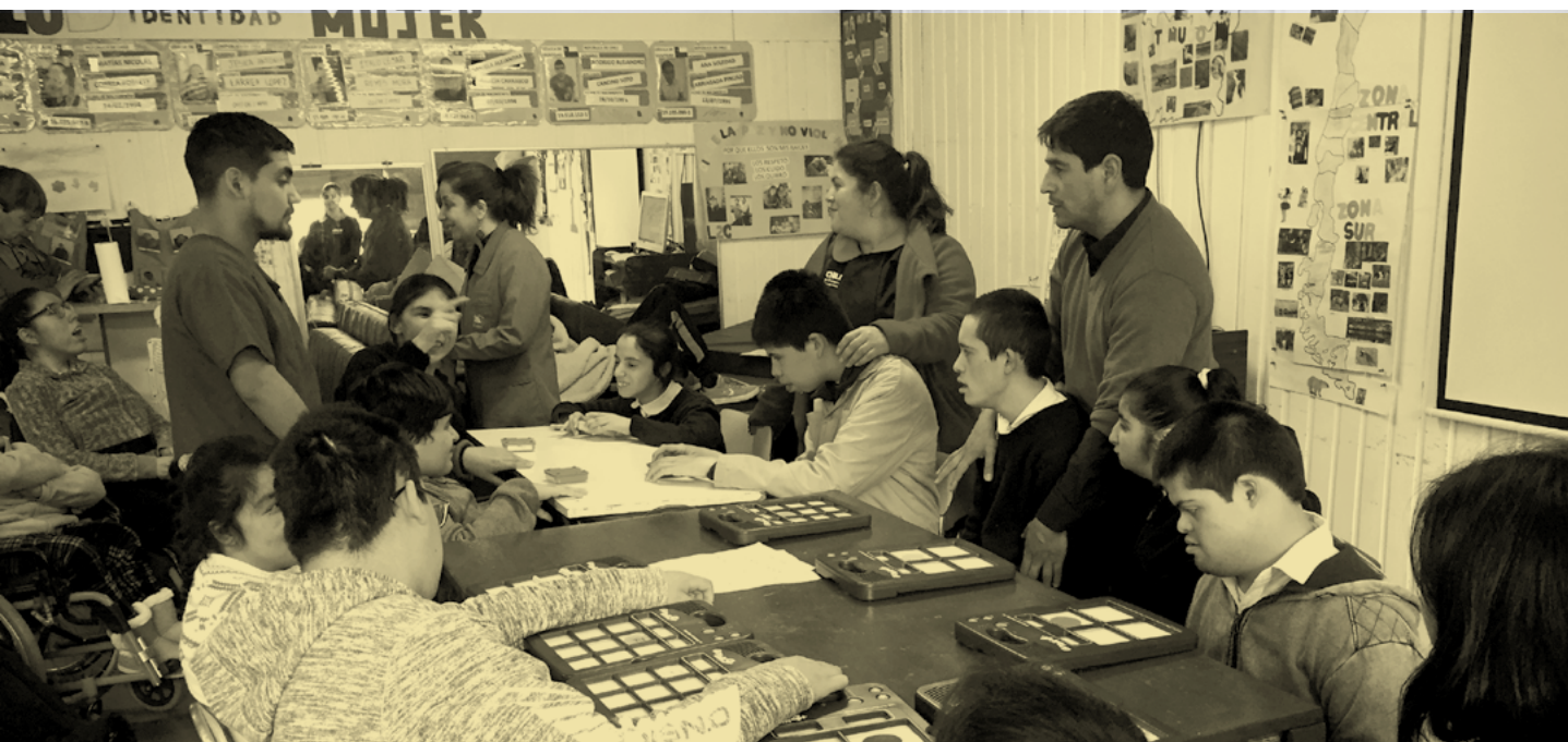
Escuela Municipal Especial Ñielol.

que les permite hablar y comunicarse—. A través de estos, se creó una canción colectiva que terminó siendo tocada en la plaza comunal ante una gran audiencia de público. El proyecto se ha flexibilizado desde la pandemia con el apoyo de los papás y mamás en casa. Los ensayos se desarrollaron de manera virtual, la práctica ha logrado que estos niños desarrollen habilidades artísticas. En teatro, se ha trabajado en el nivel laboral para desarrollar destrezas emocionales y socio afectivas con el objetivo de ser más independientes en un entorno laboral. Así, se ha potenciado el hablar y canalizar emociones por medio de palabras, a través de la escucha y la acción.