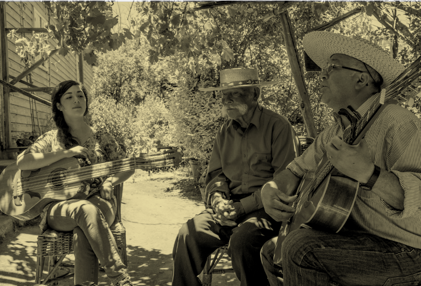
Familia Madariaga.

“Los y las estudiantes pueden llegar a ser grandes cultores naturales del canto a lo poeta”.