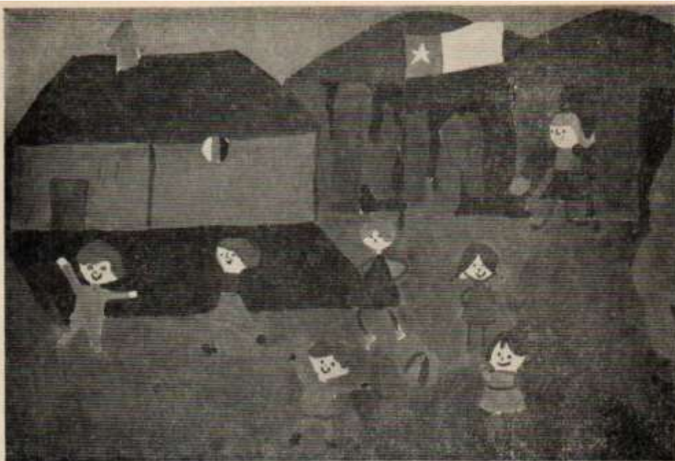
Lámina N° 4: "Jugando en el jardín"

Después el dibujo se rigidiza y se acentúan detalles de la ropa, facciones, etc. Estos detalles se acumulan en aquellas partes del dibujo que tienen mayor significación emocional para él. Se acentúa el enfoque emocional del color (Lámina N° 4 "Jugando en el Jardín").