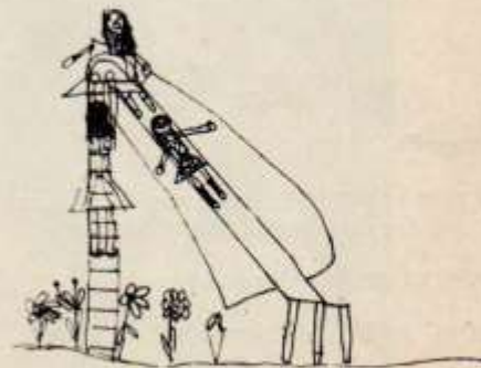
Lámina N° 5: En el parque"

Después de los 9 indica en sus dibujos la diferenciación de los sexos, acentuando las características sexuales de sus figuras. Sus dibujos continúan incluyendo acciones corporales.