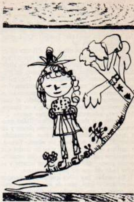
Lámina N° 1: "Yo en el jardín"

nariz y la boca, usa distintas formas para los árboles o plantas y flores, hay una vinculación del color con los objetos. Usa la línea base sobre la cual ubica sus figuras, Lámina N° 1 "Yo en el Jardín".