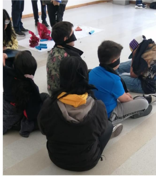
Las fotografías presentadas registran el momento de Maestranza, en la sala de música: instrumentos para explorar (izq.), tocando los instrumentos (arriba der.) y creación paisaje sonoro (abajo der.).