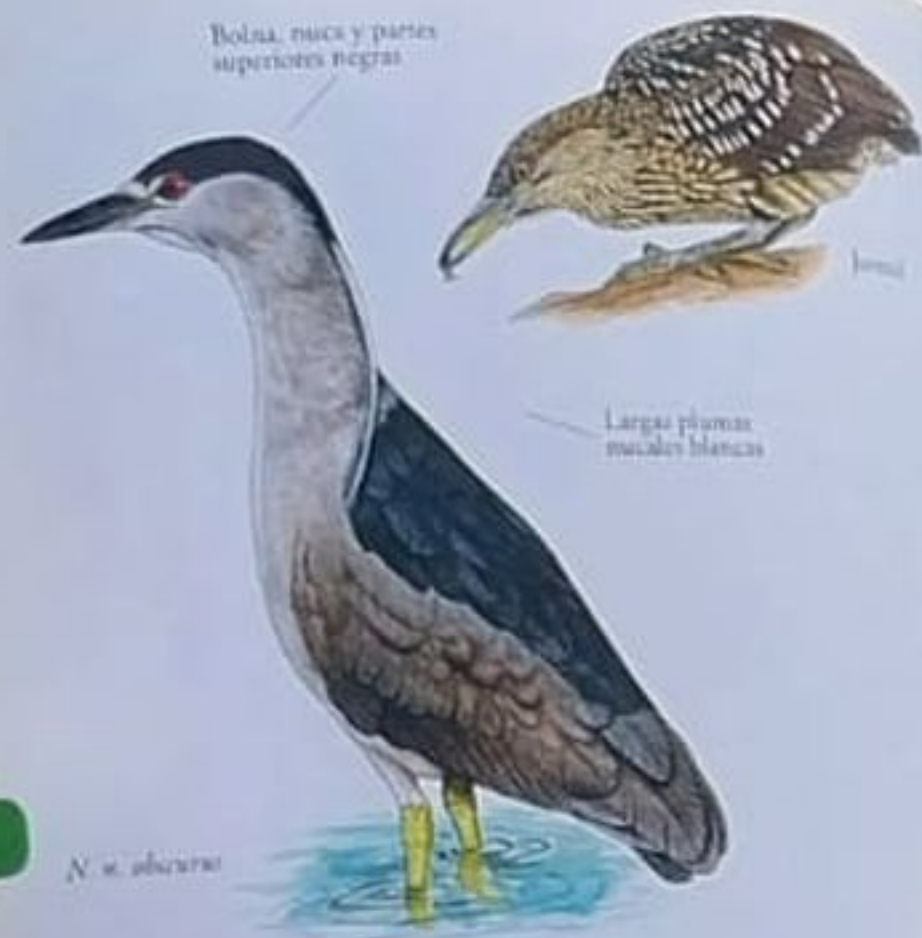
N. n. obscura