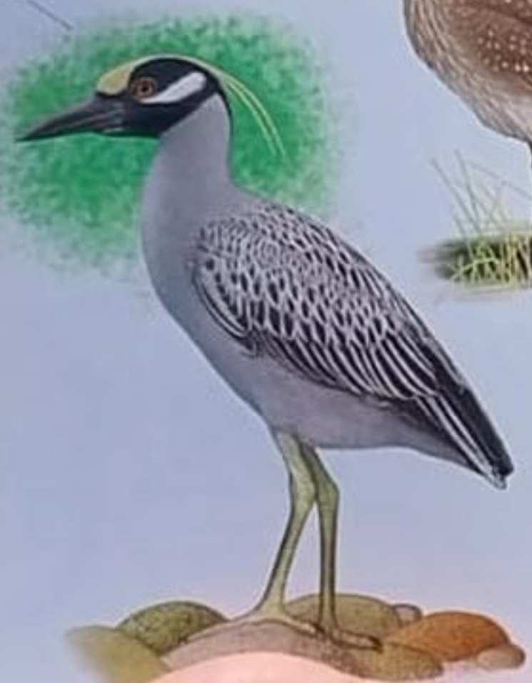
Parche color ante en la frente