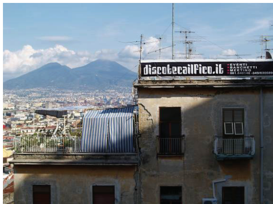
Figura 5. Las tradiciones han marcado una convivencia peculiar entre tipografías y paisaje. En barrios periféricos hallamos verdaderos manjares gráficos, como en esta terraza de Nápoles.

Observar y describir la ciudad (dibujar, fotografiar, grabar en vídeo, pintar) conlleva la aceptación de los mensajes gráficos que cubren sus arquitecturas. Los