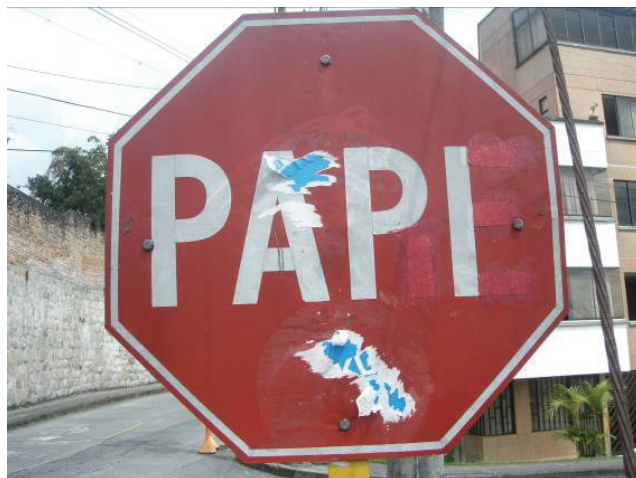
Figura 4. Manizales (Colombia). El texto “Stop” cambia a “Pare” en algunos países de Iberoamérica. Actuando sobre el texto se convierte en “Papi”.

India o Arabia Saudita, donde usan otros modelos de escritura? Todas estas cuestiones traslucen un auténtico desconocimiento del código que tanto nos sirve para comunicarnos, un instrumento visual que la ciudad luce en todos sus rincones. El profesorado de educación artística suele confiar en la intuición, ya que se nos ha inculcado un espíritu creativo mediante el cual resolver problemas de índole artístico. Para conseguir que este tipo de conocimiento llegue a las aulas hemos de intentar que el alumnado se implique, y un buen modo de intentarlo es animarle a que observe las posibilidades del texto como forma visual con carga cultural.