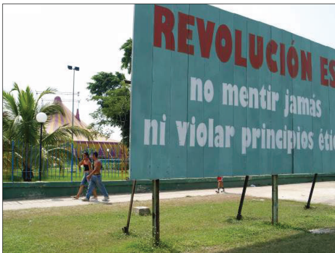
Figura 1. En la Habana no vemos carteles publicitarios de productos de consumo, pero sí vallas con mensajes políticos, con diseños decididamente tipográficos.

Uno de los escenarios más fructíferos en el encuentro urbano con las letras son los carteles publicitarios. Tanto si son permanentes como si se trata de affiches temporales (papeles pegados en una valla o sobre un muro), los carteles actualizan la imagen de productos y actividades, generando así un modelo de información que enriquece los cambios del paisaje urbano. Incluso en Cuba, un país en el que no se distribuyen carteles publicitarios de productos comerciales, podemos ver vallas de signo político o de carácter reivindicativo y social.