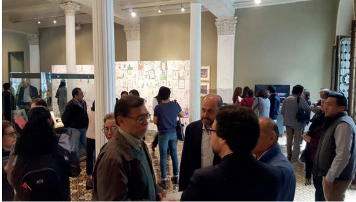
Figura 12. Numeroso público asistió a la inauguración de la exposición «Mujeres maestras del Perú» en la Casa O'Higgins.

Por otro lado, siguen las investigaciones a partir de los dibujos realizados por el alumnado. Estos trabajos son estudiados como realidad palpable de la imagen que generan de sus maestras. Los resultados del proyecto, tanto desde la vertiente de la exposición, como desde la recopilación de dibujos y de las entrevistas a maestras, son difundidos a través de artículos en revistas especializadas (Huerta, 2016), de modo que continuamos atendiendo con interés la realidad atractiva y muy recomendable del quehacer constante de las maestras.