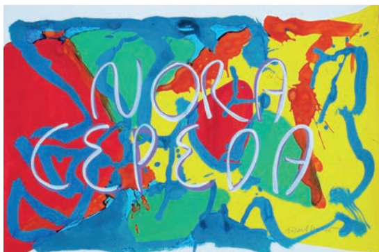
Figura 5. Pintura de la serie «Mujeres maestras del Perú» dedicada a Nora Céspedes.