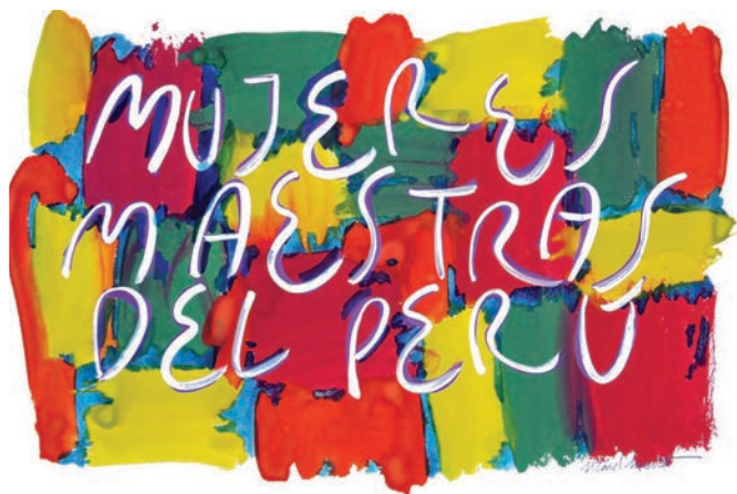
Figura 4. Pintura de la serie «Mujeres maestras del Perú». Ricard Huerta.