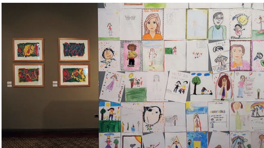
Figura 9. Los dibujos infantiles dialogan con las pinturas de la serie «Mujeres maestras del Perú» en la exposición de la Casa O'Higgins.

evidentemente una selección del conjunto de las maestras entrevistadas, a quienes se les puede ver y escuchar en el video documental. Las maestras entrevistadas colaboraron en la recolección de datos de manera completamente altruista, algo que siempre les agradeceremos. Queda escrito el nombre de cada maestra homenajeada, adquiriendo así una presencia capaz de generar un efecto caligráfico destacado sobre el fondo de color. Conviene indicar que siempre se trata de letras del alfabeto latino, de nuestro lenguaje occidental de los signos alfabéticos. También los personajes representados mediante la escritura de sus nombres responden al patrón cultural occidental, tal y como han advertido algunas teorías de los sistemas culturales. No rechazamos esta elección, provocada en parte por el hecho de conocer y entender mejor lo que nos es más próximo. El alfabeto latino forma parte de nuestro legado cultural y sus posibilidades plásticas son infinitas. De hecho, en la tradición del diseño de letras del Perú existe un gran apego hacia las formas del lettering que provienen de los letreros publicitarios de carácter popular.