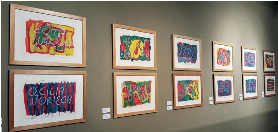
Figura 7. Pinturas de la serie «Mujeres maestras del Perú» expuestas en Casa O'Higgins.

A partir del conocimiento personal de las maestras peruanas y basándose en la muestra reflejada por las entrevistas, se procede a interpretar las pinturas. La serie «Mujeres maestras del Perú» consta de veintiuna piezas en las que se ha seleccionado a una parte de las mujeres entrevistadas, escogiendo entre el conjunto del muestreo, con el fin de abarcar el máximo de representatividad del conjunto. Cómo observa y de qué modo interpreta el artista a las mujeres de quienes ha aprendido y continúa aprendiendo. La mirada del artista reflexiona sobre las mujeres maestras aportando una perspectiva desde la creación plástica, desde las artes visuales. De este modo, la creación artística se suma al conjunto de lo que entendemos por proyecto «artográfico». Pinturas sobre papel, obras dedicadas a las mujeres que nos han hablado de su esfuerzo, de su trabajo, de sus ilusiones y de sus ideas.