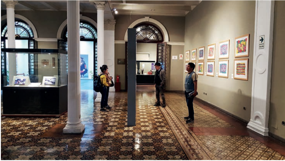
Figura 10. La Casa O'Higgins como espacio perfecto para exponer los dibujos infantiles, las pinturas de la serie y el audiovisual «Mujeres maestras del Perú».