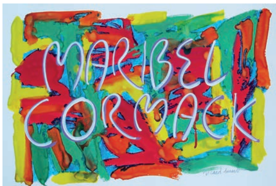
Figura 6. Pintura de la serie «Mujeres maestras del Perú» dedicada a Maribel Cormack.