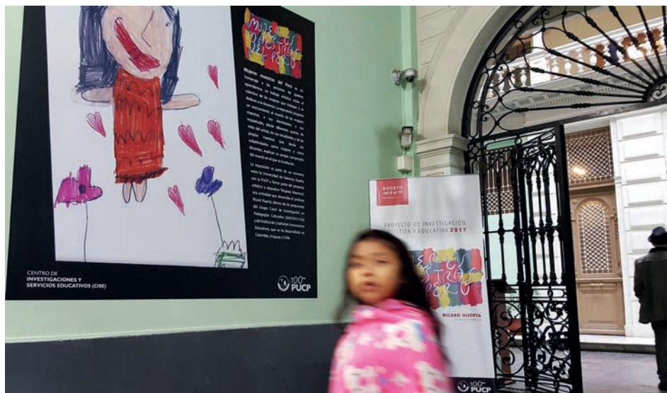
Figura 11. Niña a la entrada de la exposición «Mujeres maestras del Perú» en la Casa O'Higgins.