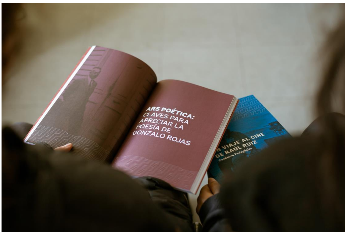
Fig5. Registro de proceso formativo asociado a los Cuadernos Pedagógicos del poeta Gonzalo Rojas y del cineasta Raúl Ruiz.

Nota: Los procesos formativos ofrecidos por el PND AE relacionados a la Colección Educación Artística han permitido su difusión y “activación”, propiciando el encuentro entre arteducadores y la reflexión sobre sus prácticas pedagógicas.