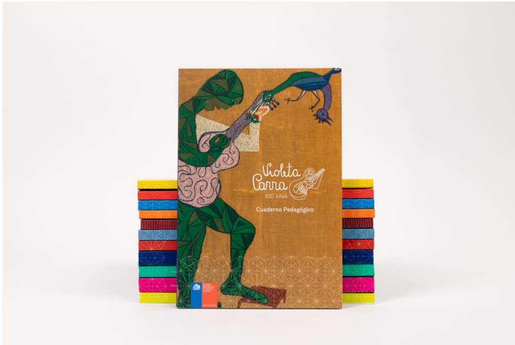
Fig1. Cuadernos Pedagógicos

Nota. 12 volúmenes publicados a 2022. En primer plano, Violeta Parra 100 años , #6 publicado en 2017.