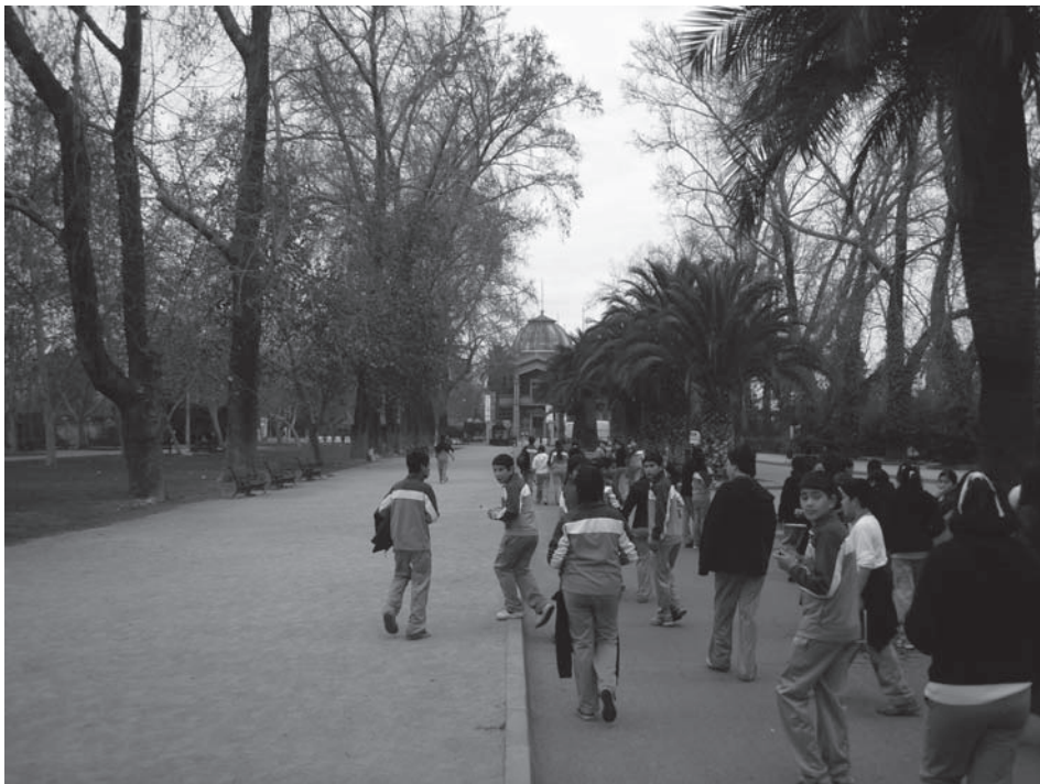
Fig. 5. El jardín de la Quinta Normal, por el cual se accede al Museo Artequín, está habitualmente repleto de escolares que se dirigen a visitar este peculiar centro de arte.

la dictadura). Seleccionamos fragmentos del testimonio de VB «Soy profesora de Artes Visuales y realizo clases en dos establecimientos emblemáticos municipales de Santiago: Instituto Nacional y Liceo de Aplicación. (...) A tu pregunta sobre la importancia de la educación, debo contarte que he tenido el privilegio de vivir grandes manifestaciones de parte de mis estudiantes, quienes, a partir del año 2006, generaron una fuerte movilización estudiantil denominada «revolución pingüina» (en Chile los estudiantes de educación secundaria utilizan un uniforme asociable a la imagen de un pingüino), en que, la pasión y reflexión de estos niños-jóvenes fue tan intensa que logró remecer a todo el país en pro de una exigencia elemental: Educación de Calidad para todos los estudiantes en Chile. (...) La experiencia que tienen mis alumnos con los museos, ha sido siempre valiosa (he recogido sus observaciones), y ha otorgado la posibilidad de desarrollar experiencias metodológicas muy profundas y significativas.»