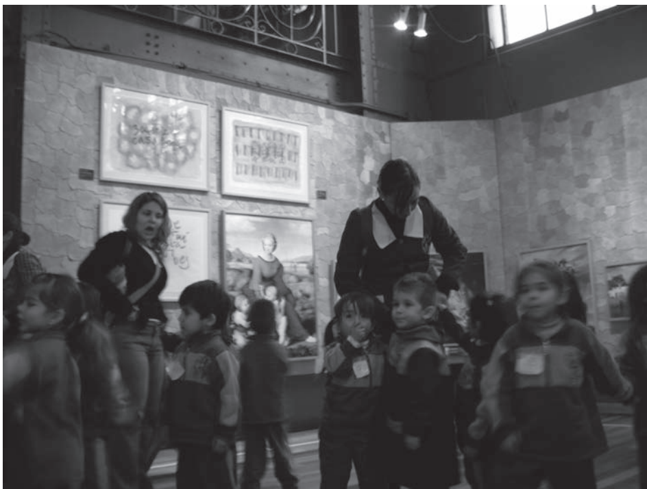
Fig. 7. Alumnado de educación infantil paseando por la muestra de Artequín con sus maestras.

iniciativa de montar un verdadero estudio de pintura en el museo para que el alumnado dibujase a sus maestras.