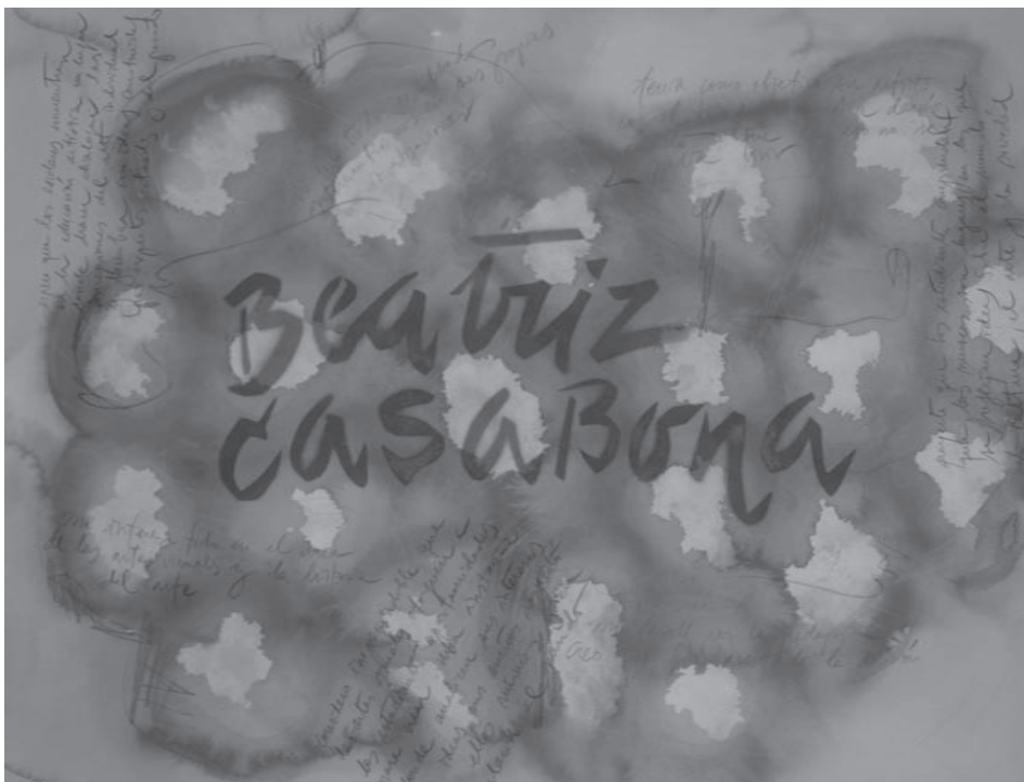
Fig. 6. Llegar a interpretar a las maestras mediante sus escritos personales supone un esfuerzo creativo e incluso de contención. La mayor recompensa se revela cuando las educadoras se ven identificadas en sus retratos.

Queremos defender que existe una gran carga afectiva en cada pieza pintada, ya que se rememora el papel importantísimo que asumen estas mujeres como educadoras. Sus nombres se leen aquí como un reflejo, como espejo de su imagen, y gracias a la musicalidad del texto adquieren resonancias particularmente auditivas. A muchas de estas mujeres las hemos conocido personalmente, aunque ha sido después de varios meses de contacto mediante correo electrónico o por conversaciones telefónicas. A través de sus textos nos aportan oportunidades de conocimiento. Con sus palabras van construyendo el engranaje de un sentido identitario particular.