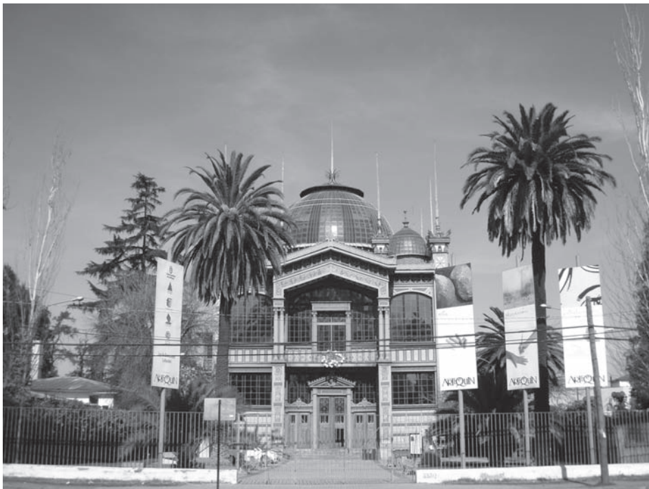
Fig. 1. El edificio del Museo Artequín es un magnífico exponente de la arquitectura más lúdica de finales del siglo XIX. Fue la sede del pabellón de Chile en la Exposición Universal de París de 1890.

donde se están instalando espacios de ocio para todos los públicos. También los jardines que rodean todo este complejo resultan muy atractivos para las familias y los grupos de visitantes. Desde la propia Fundación Artequín se fomenta la educación artística mediante programas y actividades dirigidos a públicos escolares.