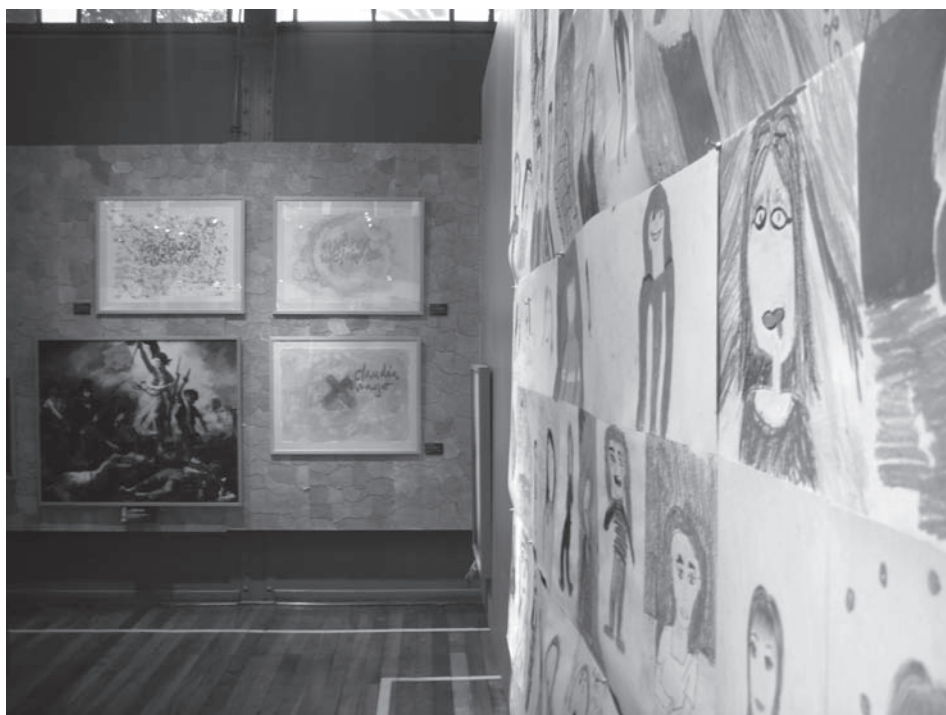
Fig. 8. Visión de un panel de dibujos del alumnado y una pared con la composición de cuadros del artista. Se intenta combinar de forma coherente la aportación de las diferentes miradas.

La exposición Mujeres Maestras de Chile está formada por tres espacios. Tres miradas a la mujer maestra, observaciones que se articulan desde tres perspectivas diferentes: la del artista, la del alumnado, y la de las propias implicadas como protagonistas, las mujeres maestras. A través de cuadros y pinturas, el artista interpreta a las mujeres de quienes aprende y continúa aprendiendo, reflexionando sobre su papel social. Autores de referencia como Henry Giroux, José Gimeno Sacristán o Pierre Bourdieu, han tanteado al colectivo docente, y nosotros accedemos a estas premisas con la intención de aumentar las referencias identitarias. Incidimos aquí en la cuestión de género, con una mirada que proviene de la masculinidad, ya que es la que aporta el artista; por otro lado está la aparición de una mirada múltiple desde la infancia, que converge en la aportación del alumnado. Introducimos desde la creación plástica una visión particular sobre las docentes gracias a una investigación educativa. Estas mujeres luchan con sus