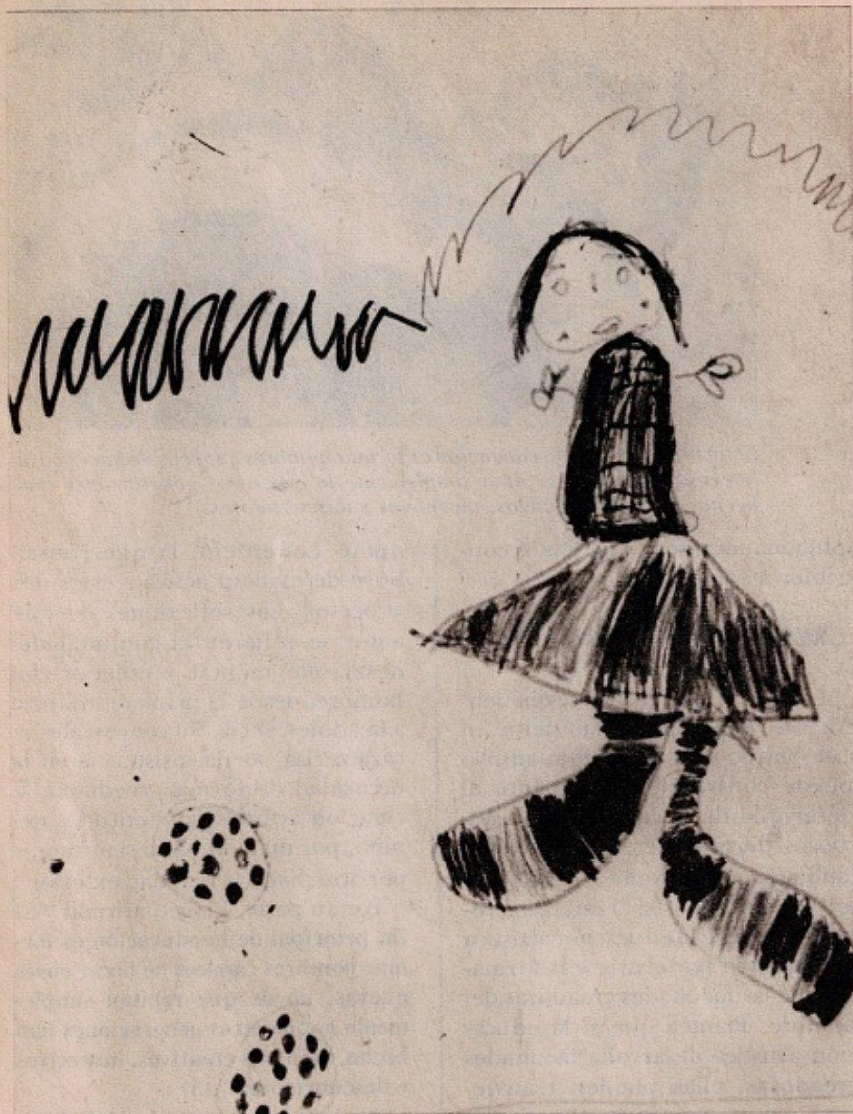
Es necesario—dice Lowenfeld—formar, mediante, la creación artística, las actitudes del niño, por un lado hacia sí mismo, y por otro hacia la realidad exterior.