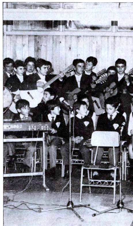
Es posible organizar en el colegio un pequeño ciclo de conciertos.

Crear un consejo cultural formado por diversos estamentos de la comunidad escolar (autoridades del establecimiento, profesores del área artística, representantes del centro de alumnos, de los apoderados, etc.). Es recomendable que estas personas