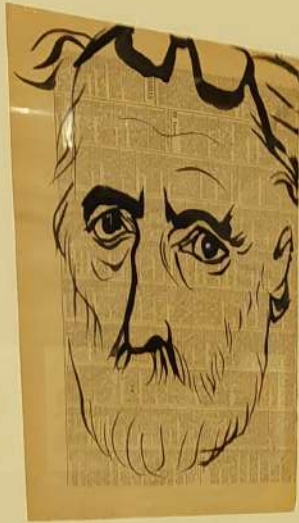
Portrait of a man, 1964