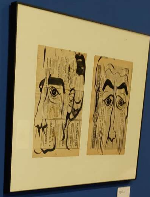
Portrait of a man, 1964